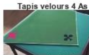
Tapis velours 4 As

Livres fondamentaux sous forme de fiches 4 livres au prix de 3