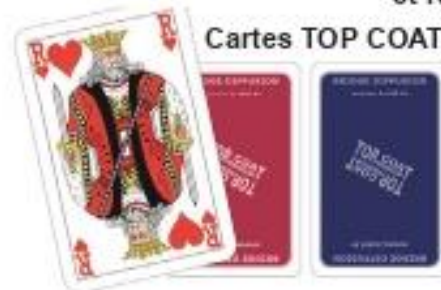
Cartes TOP COAT

Boîtes à enchères BID PAL et recharges au format international